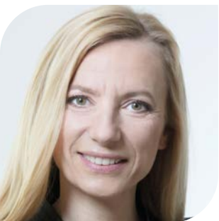
Dr. Juliane Bogner-Strauß Bundesministerin für Frauen, Familien und Jugend

Machen Sie es den über 500 Unternehmen und Institutionen in Österreich gleich und schlagen Sie den Weg in Richtung mehr Familienfreundlichkeit ein. Gemeinsam können wir hier etwas bewegen und Österreich noch ein Stück familienfreundlicher machen. Ich freue mich, auch Sie bald als zertifiziert familienfreundlicher Arbeitgeber auszeichnen zu dürfen.